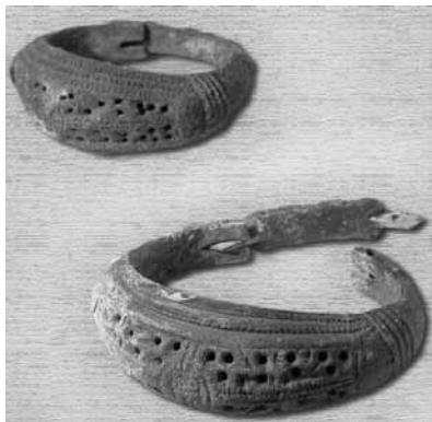
Рис. 5. Браслеты с замком (без масштаба)