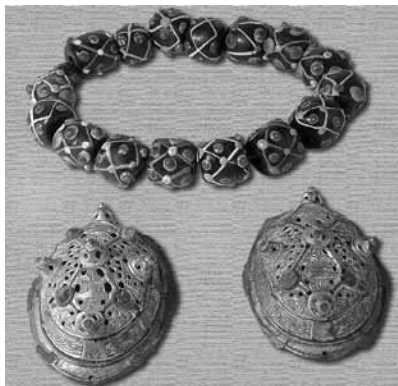
Рис. 4. Ожерелье, овално-выпуклые фибулы (без масштаба)