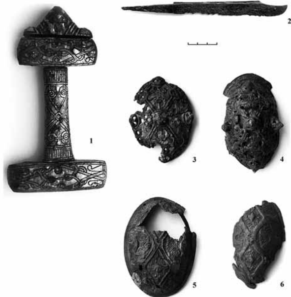
Рис. 2. Случайные находки из окрестностей Куркиёки

Этой дате, казалось бы, противоречат фибулы 37. Действительно, в Латвии на территории скандинавского грунтового могильника Смукуми IX