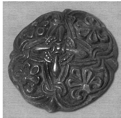
Рис. 6. Круглая фибула (без масштаба)

зарытый в лесу у д. Вихмязь около 1090 года, содержал в бронзовом котле серебряный слиток, 10 обломков украшений, монетный кружок с простой орнаментацией, 13398 в основном западноевропейских монет и 15,5 круглой монетовидной пластинки. На р. Паше близ д. Колголема выявлен еще один крупный клад, зарытый во второй половине XI века. В бронзовом котле находилось 5,5–6 тыс. в основном немецких денариев. Синхронны приладожской курганной культуре выявленные на территории Карелии три клада монет X–XI веков в Петрозаводске близ впадения р. Неглинки в Онежское озеро, на берегах озер Сандал и Падмозеро [18].