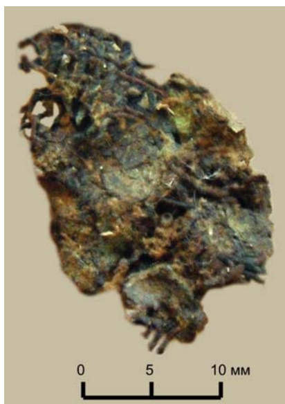
Рис. 2. Фрагмент ткани. Курган 11, погребение 3. Инв. № 816/87

Полотняное переплетение. Определить направление нитей основы, так же, как и плотность ткани, не представляется возможным. В то же время соотношение нитей и в том и в другом направлении примерно 1:1.