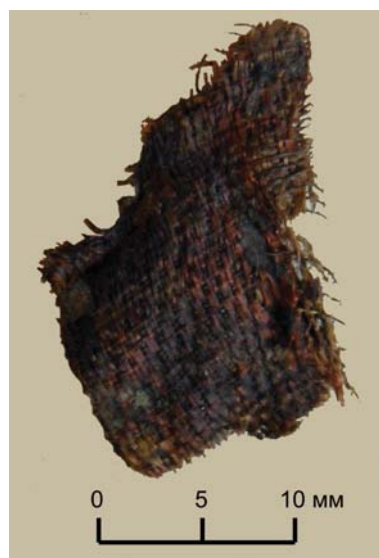
Рис. 5. Фрагмент ткани. Курган 38. Инв. №816/237 (раскопки П.С. Рыкова)

в тексте дневника раскопок он не упоминается. В этом же погребении находились бронзовые височные кольца среднего диаметра с заходящими концами и нитка золото- и серебrostеклянных бус и одной янтарной.