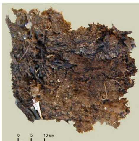
Рис. 4. Фрагмент ткани. Курган 35. Инв. №816/230 (раскопки П.С. Рыкова)

Фрагмент ткани был найден на черепе погребенной и являлся частью полотнячатого головного убора.