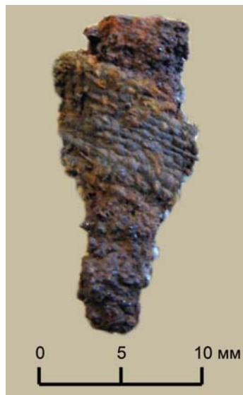
Рис. 7. Фрагмент ткани. Курган 39. Инв. №818/124 (раскопки В.Н. Глазова, 1913 г.)

В погребении также были обнаружены орнаментированные семилучевые височные кольца радимичского типа, радимичская гривна, обломки окислившегося серебряного пластинчатого очелья, литые грушевидные пуговицы, серебряный дротовый браслет с расширяющимися концами, серебряные