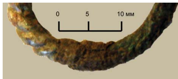
Рис. 3. Фрагмент ткани. Курган 27. Инв. № 816/171 (раскопки П.С. Рыкова)

Материал: растительное волокно, сильно окислен. Толщина сохранившихся нитей 0,25–0,3 мм.